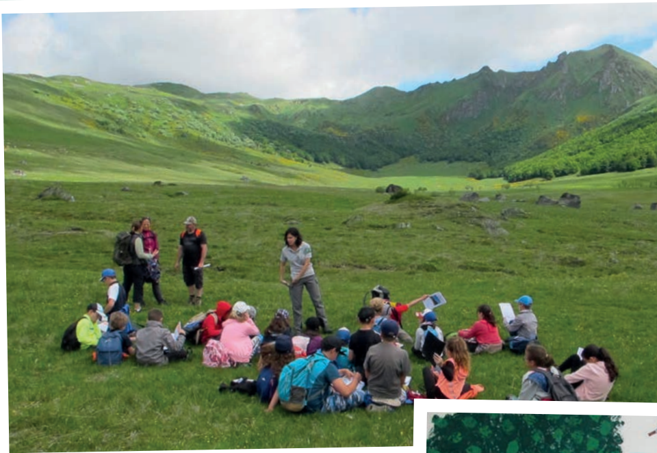
Dessin du paysage de la Fontaine salée

En 2019, 30 élèves de CM1 et CM2 de l'école de la Tour d'Auvergne ont travaillé durant 2 journées sur le thème de la forêt. Ils ont découvert le principe de la photosynthèse, les habitants des bois, les caractéristiques du sol et le fonctionnement de l'écosystème forestier. Une grande fresque forestière a été réalisée par les enfants.