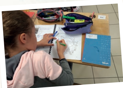
Coloriage dans le carnet pédagogique

Depuis 2019, l'équipe de la réserve réalise des animations auprès des scolaires. Chaque année, une école primaire située à proximité de la réserve bénéficie d'un projet pédagogique complet sur un thème alliant culture et nature. Les enfants travaillent ainsi sur deux approches complémentaires, scientifique et artistique.