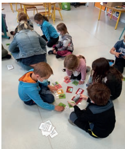
Des activités pour mieux comprendre les impacts des activités humaines sur les insectes

« C'est une opportunité formidable pour les élèves. Elle ancre les enfants dans leur territoire en leur apprenant ses spécificités et les comportements de respect à adopter. Ces actions prennent tout leur sens car il s'agit d'interventions pratiques sur le terrain, qui permettent aux enfants d'expérimenter et d'observer les lieux. C'est également une ouverture au métier de garde de la réserve, souvent méconnu des enfants. »