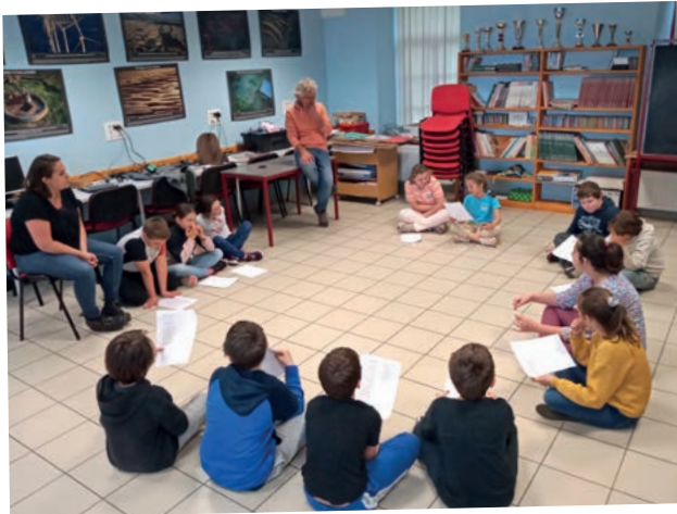
Au programme des séances théâtrales : entraînement à la prise de parole, travail des postures...

En 2021-2022, les 15 élèves de CM1-CM2 de Picherande ont travaillé sur la biodiversité et les fables de Jean de la Fontaine. Il s'agissait de réaliser un spectacle lors de la fête de la réserve, avec l'aide d'un metteur en scène professionnel, Hervé Marcillat. 11 séances ont été réalisées, dont 7 avec un agent de la réserve.