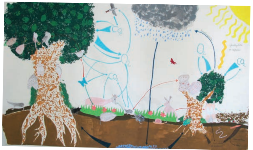
Fresque des différentes interdépendances entre les espèces et leur milieu