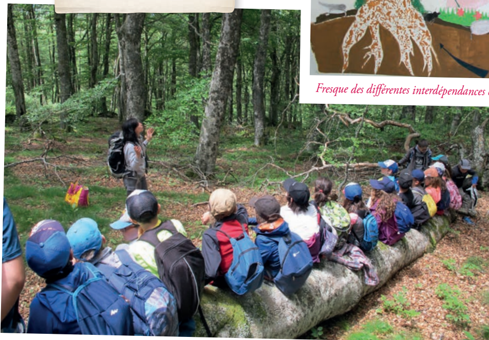
Observation d'une hêtraie de la réserve

« La réserve de Chastreix, c'est où on protège les animaux sauvages, les arbres, les paysages on les observe pour qu'ils ne disparaissent pas. On regarde ce qui va, ce qui ne va pas dans la nature. »