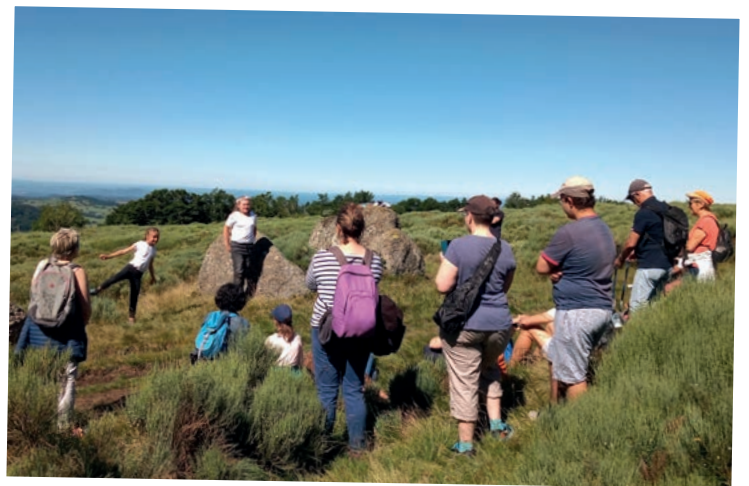
Lors des 15 ans de la réserve, les enfants ont joué leur spectacle devant 60 personnes