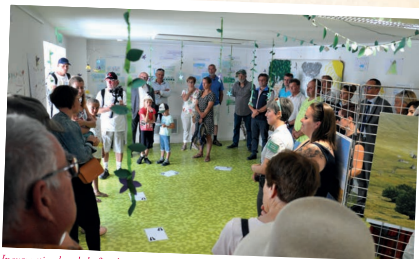
Inauguration lors de la fête des 15 ans de la réserve